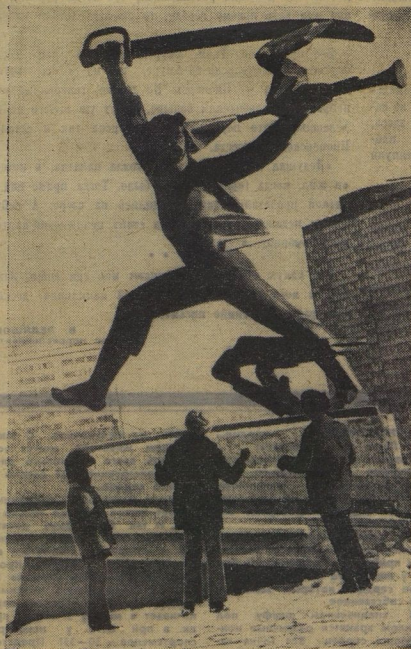
Встреча с будённовцем.