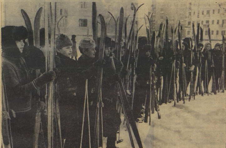
Совет дружины бросил клич: каждый пионер должен выйти на старт. Лыжники из 16-й школы города Воркуты готовы к старту. Все отряды аступили в спортивную борьбу за звание сильнейшего в мюноборье ГТО. Построение — боевое! Чей же отряд окажется самым сильным?