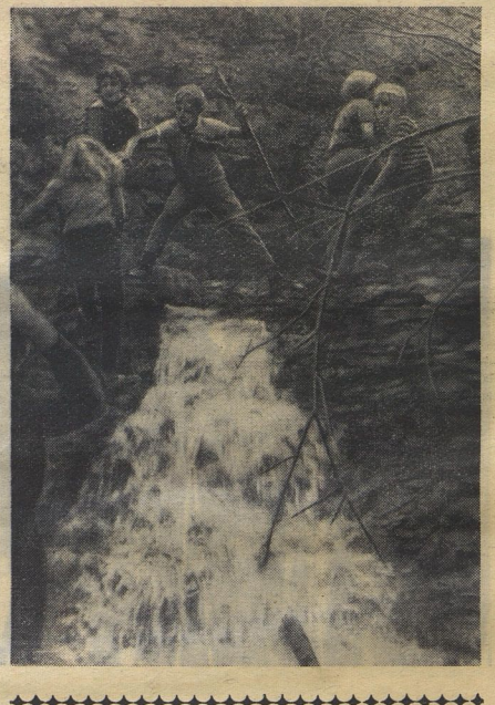
Отряд 7-го класса «В». Становлянский край, г. Ессентуки, школа № 10.

В четырёх километрах от станции Подпукое есть очень красивое место — оно так и называется Долина очарования. Первым из нашего отряда там побывала зено Турист. Она стала и нас как бы разведчиком. И в осенний поход зено «Турист» повело по разработанному маршруту весь отряд. Мы прошли по долине до самых двух ручьев и там, к северным левоу склона. Третья здесь нет. Пробегались прямо по рисуну реки, через заросли леса и кустарника, шедши по камням на краю водопада. Удалось достичь истока реки — она берёт начало из ручья, который пробегается у подножья известковой скалы. О том, что это река, такие мажуге с собой зено, начекается с тонких ручейков или пробивающихся сквозз землю источников, мы, конечно, не раз слышали на уроках географии. Но вот увидели это впервые.