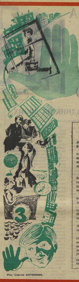
Рис. Сергей АНТОНОВА.

● Когда посылка приходит с обратным адресом: «Ивановская область, Кинешемский район, Решетневская средняя школа», работники ВДНХ знают, что в ней не безденежны. Седьмой раз tonight этой школы призывают в Москву свои экспонаты для участия в выставке.