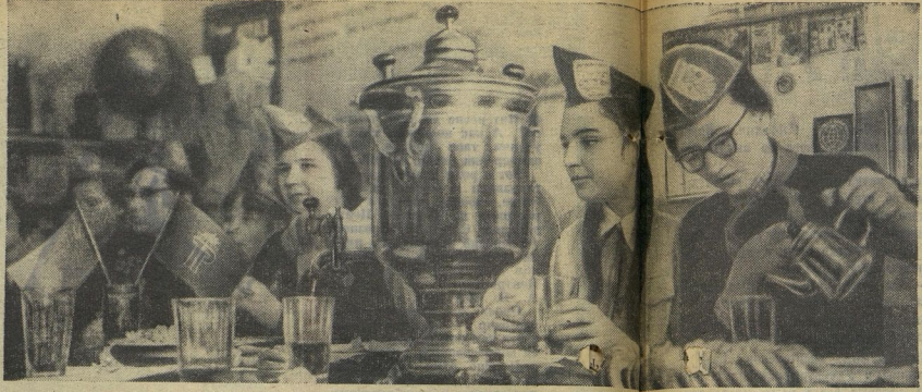
Юные интернационалисты Владимирского Дворца пионеров отмечают праздник своих друзей из ГДР.