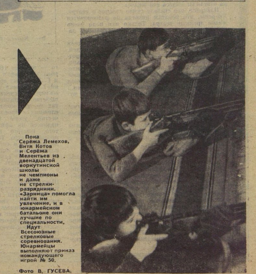
Рис. В. ГУСЕВА.