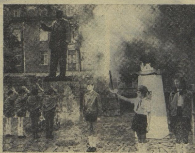
В руках у юной пионерки «пламя Бухенвальда». В Бухенвальде был злодейски убит вождь немецкого рабочего класса Эрист Тельман.