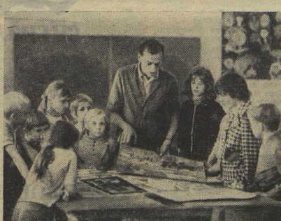
Задача у ребят города Шведта-на-Одере серьезная. Их школа заслужила право участвовать в юбилейной выставке рисунков в Берлине. Выполняют ребята. Но учитель милое и рисования товарищ Голински сломал. Работы юных художников школы уже были на многих международных выставках. Для юбилейной выставки юные художники подготовили портреты своих зарубежных сверстников — участников Ф. фестивалей.