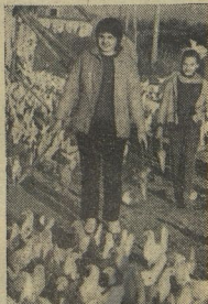
Хозяин «муриног царства».

Юные тимирязевцы Отчёты и репортажи о важных делах за этот год высылаете в редакцию газеты не позже 25 ноября.