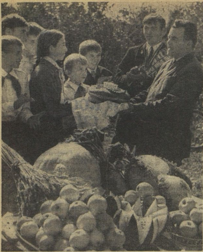
Примите наш каравай!