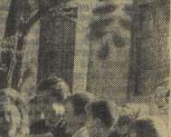
Весело было на празднике урожая.