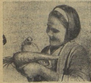
Морковня — свояш витаминный.