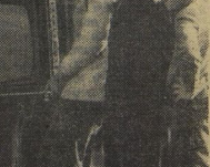
Весело было на празднике урожая.