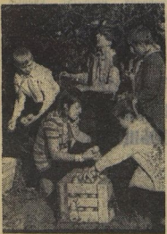
Яблоно и яблочку — и ящички полные!