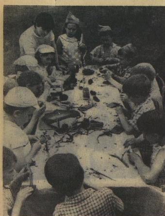
В последние дни лагерного лета отряды из пионерского лагеря «Ириски» Московской области готовили подарки школе и 1 сентября САНХОВСКОГО.