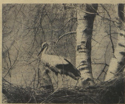
Это слышится каждый год: Покии скрываются, движется лёд, И высоко, над садами и крышами, Аисты клювами щёлкают... Слышите?

Астраханская областная станция юных техников.