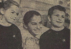
7-й день — ПРАЗДНИК ВОЖАТОГО.