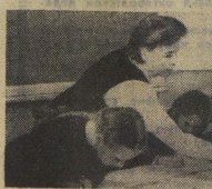
3-й день — ПРАЗДНИК КНИГИ.