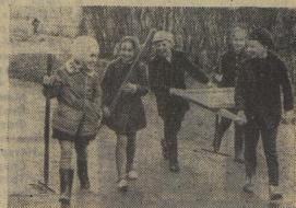
6-й день — ПРАЗДНИК ТРУДА.