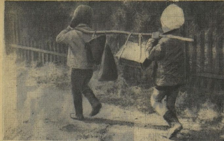
«Вместе нам веселее, вместе мы вдвое сильнее!»