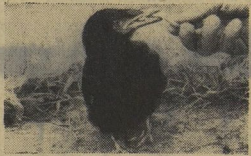
Красноперекопный край, г. Киев.