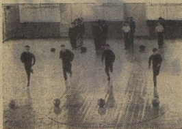
4-й день — ПРАЗДНИК ЗДОРОВЬЯ.