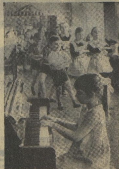
5-й день — ПРАЗДНИК ДРУЖЬБЫ.