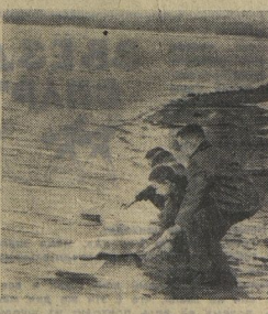
2-й день — ПРАЗДНИК ИГРУШКИ.