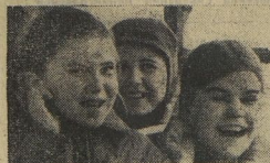
1-й день — ПРАЗДНИК КРАСНОГО ГАЛУСТА.