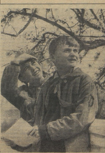
Можно увидеть парящую чайну сивозь ветки миндала. Можно увидеть большой горизонт и не забираться на Людг. Нужно очень многое уметь видеть, чтобы выпустить газету, да ещё с таким названием, как «Горизонт».

Юнкори пишут заметки. Вы спросите: чем ещё они могут заниматься? А вот чем... Приходит однажды ребята в 113-ю минскую школу, а у входа огромная афиша висит. Оказывается, в школе киноklub открывается. Вход свободный. Хочешь — кино смотри, хочешь — сам кино скрути. Научат тебя с кинопроектором обращаться. Перед сеансом юнкори расскажут об авторе фильма и о том, как его снимали. Это они, юнкори, договорились с кинопроектором, чтобы кино можно было прямо в школе показывать.