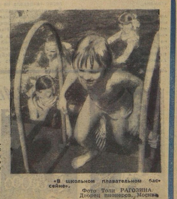
«В школьном плавательном бассейне» Фото Толи РАФОНИНА Директор пионерлагеря, Москва

■ Суровая у нас зима: метели, снежные бураны. Выйдешь на улицу во время затишья — кругом сугробы. Хотьешь — крепости строй, хотьешь — на лыжах катайся. И мороз в силе: —40° —50°. Но народ у нас закалённый. В любое время рабочие строят дома, заводы, дают стране олово, золото. Также уж у нас люди на Чукотке. Вадим ЩЕРБАТЕНКО, ученик 3-го класса «Б», Чунотья, посёлок Вальдуйский.