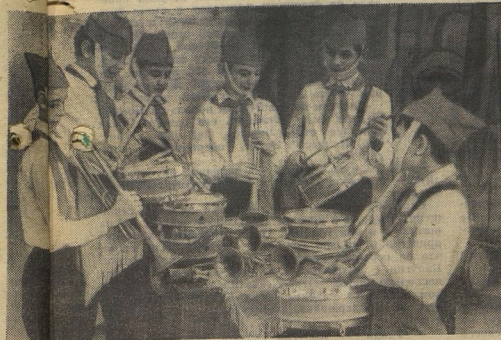
Орионисты и барабанщики готовятся к сбору дружины.

Недавно по соседству с нами открылась новая школа, и часть ребят переехала туда: в новую школу им ближе. Но ушли не все. Многие остались. Потому что привыкли. Потому что рядом товарищи, которым до всего есть дело.