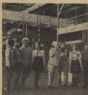
На комбинате синтетического волокна гости.

Напереро, мне, ответственному за «Пионерстрой», надо знать и количество посаженных деревьев, и число клубов. Но как-то не обращаешь на цифры внимания. У нас так: видим место пустое, голое — значит, надо его озеленить, скамейки поставить, мусорницы... Изменилось, похорошело место — вот и «показатель».