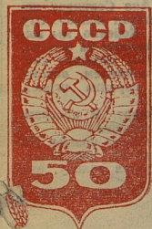
Рисунок ЖЕТЫ ФОНШИ.

Год издания 48-й / Вторник, 28 ноября 1972 г. / Цена 1 коп.