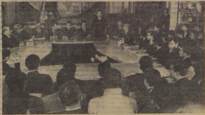
Торжественным было закрытие шахматного турнира. В клубе интернациональных встреч Московского Дворца пионеров гроссмейстеров и участников турнира приветствовал первый секретарь ЦК ВЛКСМ Е. М. Тяжельников.

Интерес к турниру был огромен. — сказал главный судья соревнований гроссмейстер М. М. Ботвинник. — Рад, что пионеры оправдали мои надежды. Молодцы! Они «отобрали» у гроссмейстеров 36,5 очка. Юные шахматисты играли с большим воодушевлением, и счёт не всегда был в пользу гроссмейстеров. Клубу «Белая ладья» попутного ветра и тугих парусов! Дерзайте, ребята!