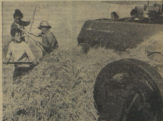
Армянские школьники на уборке хлеба.