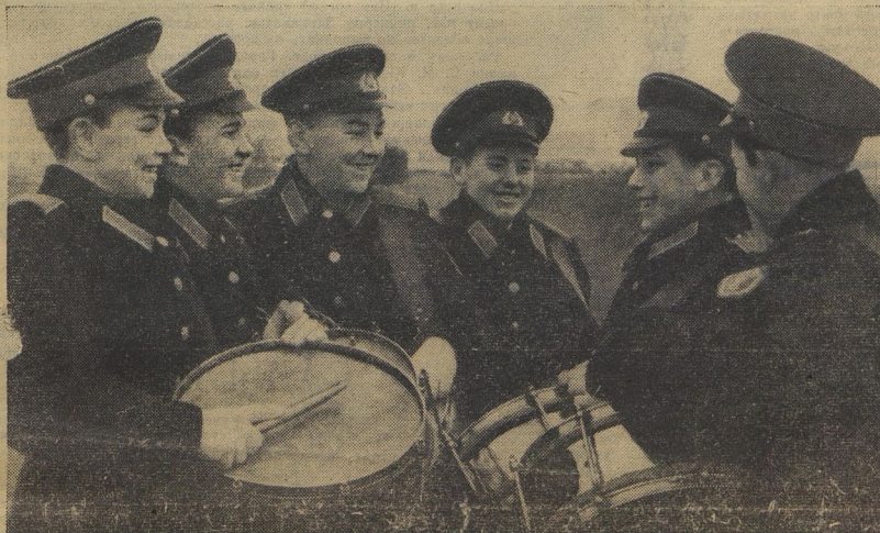
Поминишь, как начинается военный парад на Красной площади 7 ноября? Рассыпается барабанная дробь. Мимо трибун Мавзолея проходят юные барабанщики. Вот они — воспитанники Московской военно-музыкальной школы! Им открывать парад и в этом году. А пока — каждый день репетиции...

Год издания 48-й № 87 [5670] ВТОРНИК, 31 ОКТОБЯ 1972 г. Цена 1 коп.