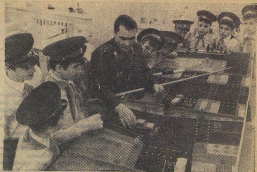
Разбуди этих ребят среди ночи — на любой вопрос по правилам уличного движения ответят. Без запинки. Они из отряда юных друзей милиции 13-й школы Новгорода. Занимаются с ребятами работниками городского отдела ГАИ.