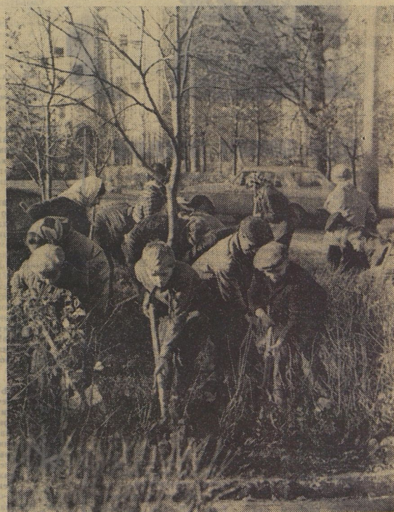
По школьному радио объявили: «Начинаем операцию «Наш микрорайон». Слово обновились дворы и улицы, примыкающие к 7-й химинской школе. Собраны опавшие листья. Всюгодняя земля у деревьев и кустарников. Видите, как дружно работает отряд 7-го класса. «5»? От них не отставали и другие отряды. Улыбались, глядя на ребят, прохожие. Недаром ведь операция «Наш микрорайон» проходит под девизом «Дарить людям радость».

★ Пятница, 27 октября 1972 г. ★ Цена 1 коп.