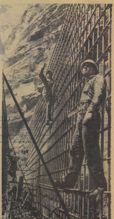
Нурекскую ГЭС в Таджикистане строят вся страна. Это не просто слова. Из Душанбе сюда везут цемент и шифер. Из Братска идут составы с лесом. Ашхабад и Улан-Удэ присылают стекло, Ташкент — кабель. Будут работать на станции турбины из Харькова, генераторы из Свердловска, трансформаторы из Хмельницкого.

Урожай риса в нашем совхозе растут из года в год. Если в 1962 году было 29 центнеров с гектара, то сейчас в среднем по совхозу — 48 центнеров. А на участке ученической производственной бригады урожай в этом году — 62 центнера с гектара.