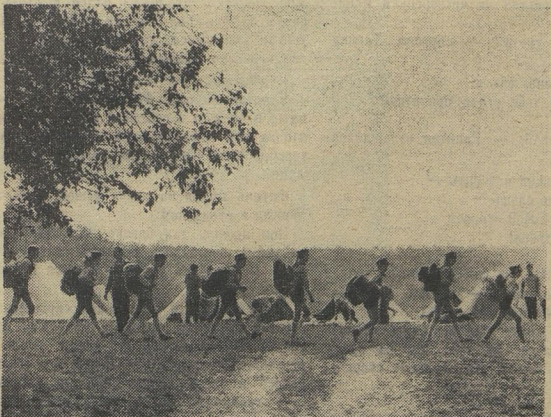
НА БЕРЕГУ РЕКИ КАШИРКИ

НА АГишева не любит наши. Станете такой же турист без наших! Зато на туристской эстафете Надя палатку поставила, рюкзаки уложила — судьи только и сказали: «Молодец!» Андрей Гудков всё юманду 67-и школы по косогору. Но на одном этапе получилось, как в детской считалочке: «С юнчи на кончу — в ямку бух!» Растерли очи. Только ребята говорят, что на слёте туристов Москвы не очи были глазами. Во время слёта туристы провели трудовой десант в совхозе, участвовали в викторине по краеведению, делали для школ сувениры из основных шпигей да забавных веточ. НА СНИМКАХ: один из этапов эстафеты «Разминание настра»: палаточный город «уходит» в поход.