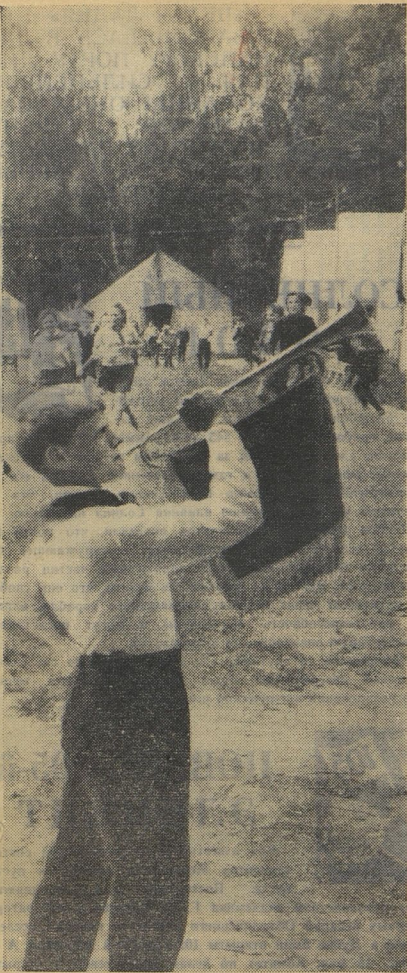
И снова трубят «сбор» лагерный горнист. Здравствуй, лето! Доброе утро, лагерь!..

Маленькая шумная страна возникла на поляне. Прислушиваются птицы к всёсному ребячьему гомону и отвечают звонким щебетом. Разбужен лес. И речка под горой, и ромашковый луг, и тропинки, уводящие в лесные дали, наконец, дождался своих верхних и добрых друзей.