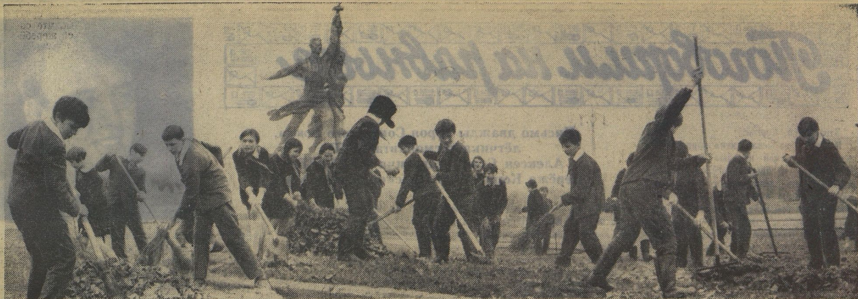
На субботнике — москвичи из 16-й школы-интерната. Ребята убирают территорию ВДНХ. Работники Выставки достижений народного хозяйства — их шефы.