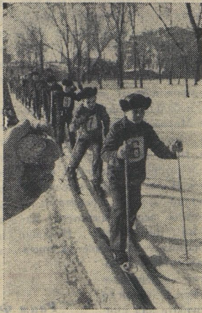
▲ В курской школе-интернате идёт сдача норм комплекса ГТО первой ступени. НА СНИМКЕ: стартуют мальчики 12—13 лет.