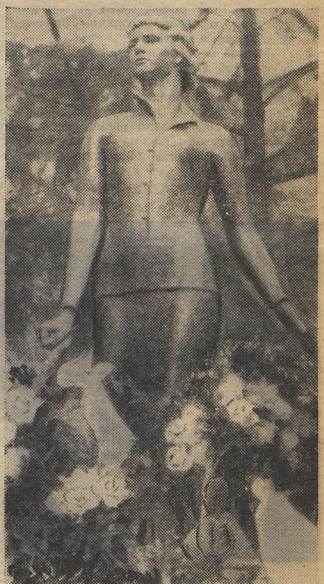
ПАМЯТНИК НАДЕ КУРЧЕНКО