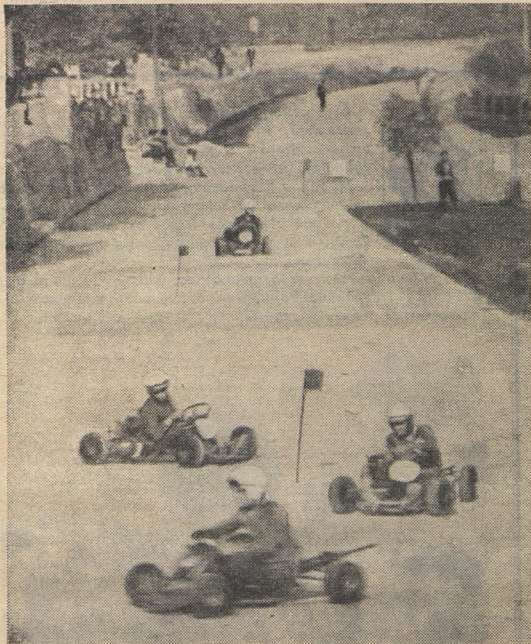
Фотографию «СПОРТ ЮНЫХ, СПОРТ СМЕЛЫХ» сделала Оля Лаврова из города Грозного.

Кроме разнообразных почётных и интересных призов участников финала ожидают показательные выступления взрослых картингистов — членов сборной команды СССР. Тренируйтесь!