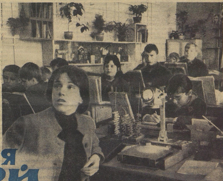
Хорошо работается в таком кабинете. Недаром математика стала одним из любимых предметов шестиклассников. Балла Васильевна задаёт вопрос и ждёт: — Ну, кто хочет ответить на пятёрку?

Год издания 47-й | Пятница, 14 января 1972 г. | Цена 1 коп. № 4 [5587]