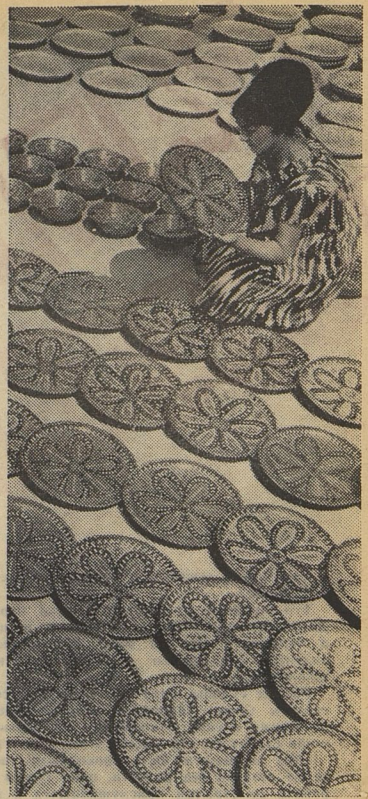
«Ташкентские орнаменты». Это изделия Ташкентского керамического завода.

И вот на следующий день во дворе школы раздался стук молотка, визг пилы. Пионеры делали ящики для хлопка и обёртывали их красной материей. Потом расставили их вдоль дороги, на ветки деревьев повесили. На ящиках написали: «Внимание! Хлопок!». Теперь никто не пройдёт мимо. Увидит человек на дороге хлопок, обречённый с машины, — подберёт его и положит в ящик.