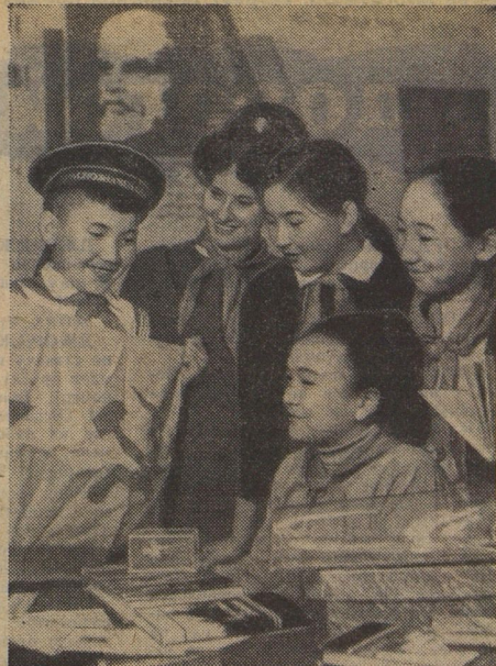
Пионеры из школы № 13 города Фрунзе и моряки из Кронштадта дружат. Когда приходят письма от моряков, книги, памятные подарки — в школе самый весёлый день.

Так завершился визит дружбы. Он был недолгим, но трудно измерить огромное значение его для благополучия всех европейских народов и общего мира.