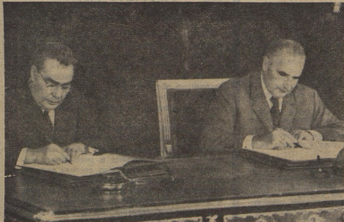
Л. И. БРЕЖНЕВ и Ж. ПОМПИДУ подписывают в Париже совместный советско-французский документ.

Рассказ о завершении визита товарища Л. И. БРЕЖНЕВА во Францию читайте на 3-й странице.