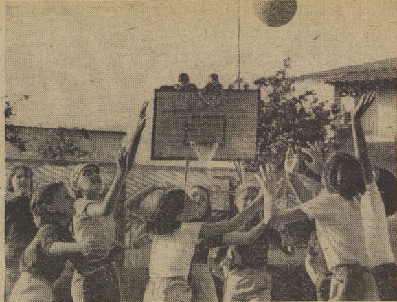
Словно мячи, скачет счёт. Как хочется выиграть! К победе стремится каждый. Но даётся она только самым сильным, самым решительным, самым ловким. Через несколько минут судья объявит: победил 4-й отряд! В пионерском лагере «Мамайыз» идёт спартакиада. Соревнуются футболисты и теннисисты, пловцы и баскетболисты. Дипломы чемпионов увезут с собой многие ребята.

В. МОРОЗОВ. (Наш корреспондент). Минская область, пионерский лагерь «Загорье».