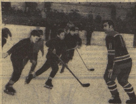
Каждому мальчишке хочется в этот момент позвать вса, но что он способен в хоккее. Еле сдерживаются, чтобы не сказать Фирсову: «Анатолий Васильевич, посмотри-те, нан у меня получается...»