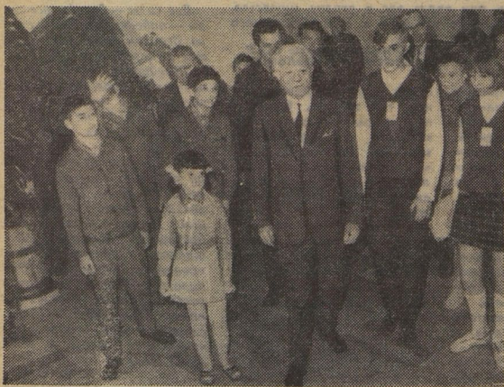
Самый почётный гость.

6. Что бы вы хотели пожелать младшему поколению Советского Союза и Чехословакии, пионерам?