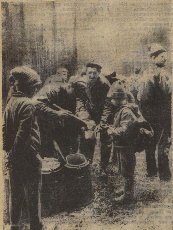
Здесь сражались чешские партизаны. Отряд пражских пионеров на привале.

4. Наши читатели мало знают о короткой, но героической жизни вашего сына. Не могли бы вы рассказать характерный случай из его жизни?