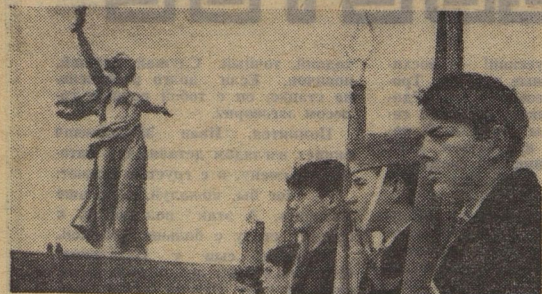
В почётном карауле застыли мальчишки на Мамаевом кургане.

2. У вас, вероятно, была возможность встречаться с советскими пионерами. Расскажите о своих впечатлениях.