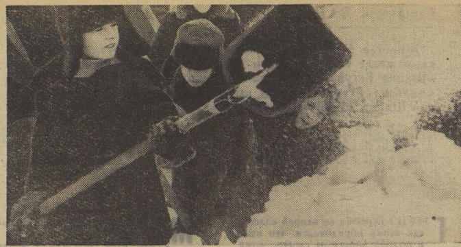
...А снега на Урале хватает!