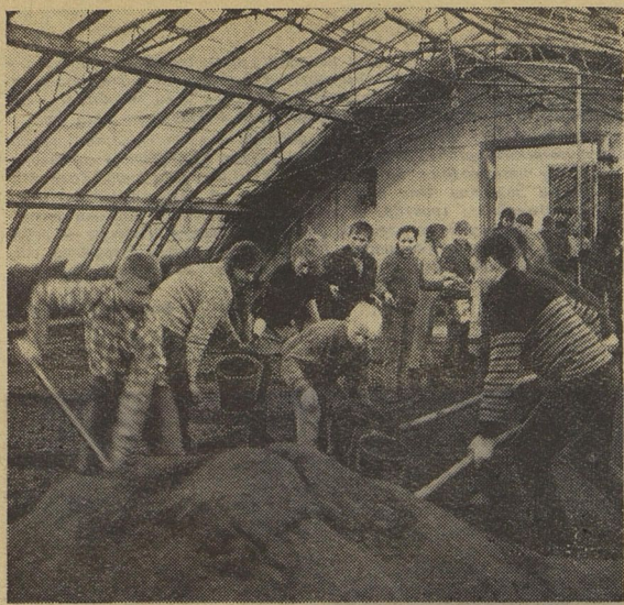
Трудовой десант у пионеров Лазурненской школы в совхозных теплицах. Будут и Первомай помидоры!