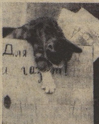
«ПРОЯВИЛИ ИНТЕРЕСНУЮ ПЛЕНКУ».