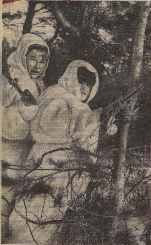
«В ДОЗОРЕ».

На проведённых в последние годы крупных войсковых учениях «Днепр», манёврах «Двина», на флотских учениях «Океан» советские воины показали высокое мастерство и выучку. Они бдительно стоят на страже мира и готовы выполнить любой приказ Коммунистической партии и Советского правительства.