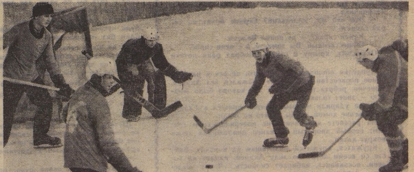
После январской оттепели вновь пришли морозы. Запела судейская сирена, заматалась на ледяных площадках шайба. Соревнования на приз клуба «Золотая шайба» в разгаре! Чемпион чемпионов рознь. В Брянске, например, обыграл 3—4 команды — получишь медали победителя. Труднее взойти на пьедестал в Челябинске. 1120 команд сражаются на городском турнире. В скорости и технике юные хоккеисты не уступают друг другу. Секрет прост: силами ребят построены 255 коробки. Наш фоторепондент заснял момент упорного поединка команд «Спартак» и «Полёт». Победили хоккеисты «Полёта» со счётом 4:2.

Вам тоже придётся потрудиться так, чтобы к концу новой пятилетки вы смогли вместе со всем народом сказать: да, мы сделали важный шаг, ещё один шаг к коммунизму.