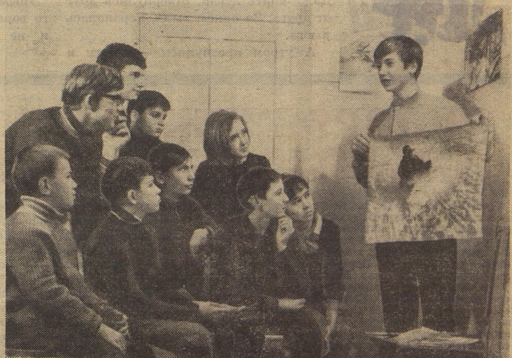
УРЕБЯТ КЛУБА «ЮБИЛЕЙНЫЙ» ЖЭК МЕТАЛЛИСТОВ МАГНИТОГОРСКА ВСЕГДА ПОДРУЖИ ФОТОАППАРАТ. СКОЛЬКО НЕОЖИДАННЫХ И ЗАБАВНЫХ СЛУЧАЕВ МОЖНО УВИДЕТЬ! ВСЕГО

Узбекская ССР, Бухарская область, г. Гиждуван, школа имени Тельмана.