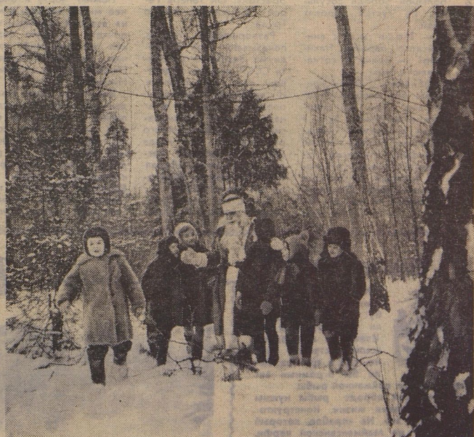
Вдруг откуда ни возьмись Дед Мороз появился. Да как начал всякие лесные истории рассказывать!.. Вот какое событие произошло в подмосковном пионерском лагере «Спутник».