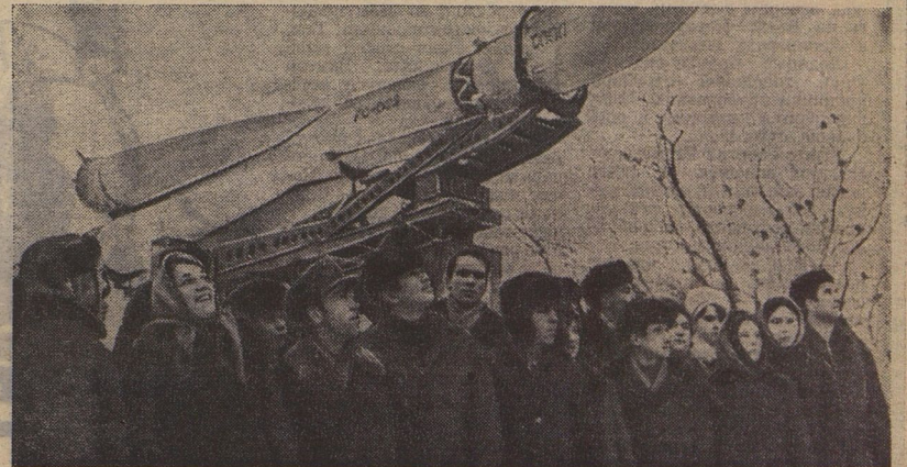
Участники Всесоюзного съезда осматривают Выставку достижений народного хозяйства.

Это он, председатель, помог нам построить — за селом палаточный лагерь. А летом мы уезжаем отдыхать на море — Илья Михайлович даёт нам автобусы. И колхоз наш богатый: много фруктов, молока, хлеба. Все мы рады, что у нас такой председатель. Я очень хочу ему нравиться.