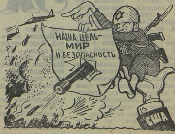
Рис. Л. СМЕКОВА.

На словах оккупанты клянутся, что единственная цель Израиля — достижение мира и безопасности. На деле — отказываются освободить захваченные силой территории, срывают важные политические переговоры и постоянно грозят арабским странам новой войной. (Из газет).