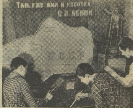
Один кадр сменяет другой... На зрание места, связанные с жизнью Владимира Ильича Ленина. Включен магнитофон, и голос диктора даёт пояснение каждому кадру. Такой стенд создали московские ребята из клуба юнтехников «Восход». Они будут участниками предстоящей выставки творчества юных техников, которая откроется в Москве, в Манеже.

В. МОРОЗОВ. (Наш корреспондент. Минская область.)