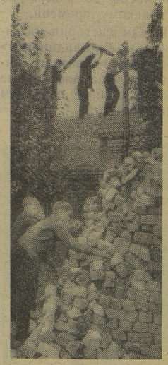
Теперь и в школе будет свой столवार.