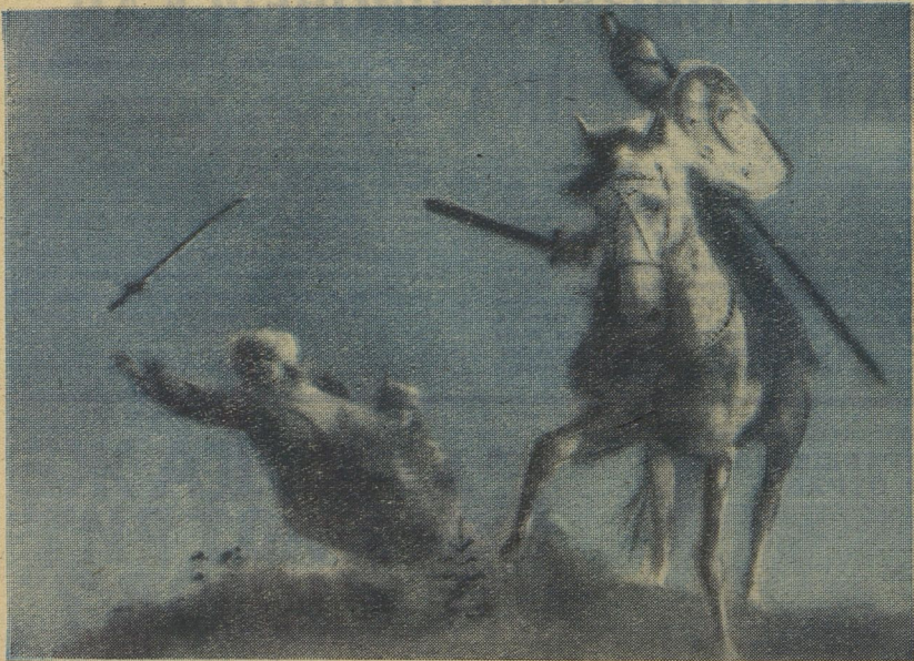
То был Руслан...

...Всё началось рано утром. Выгрузили и установили что-то волшебное. Впоследствии оказалось, что это кинокамеры. Два кудесника оператора — Захаров и Гелейн со всех возможных точек осмотрели поле будущей битвы. С опаской поглядывая на солнце — воевать лучше в ясную погоду.