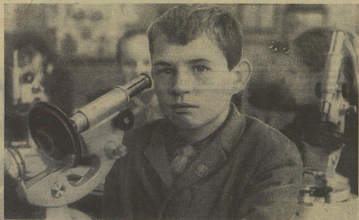
И большие открытия начинаются с микроскопа...

Летом в «Пионерской правде» рассказывалось о «Малой Тимирязевке». Сегодня мы печатаем условия её организации и рассказ нашего корреспондента о работе юнцов Вязовицкой школы Липецкой области. Думаем, что их опыт поможет и вам организовать у себя в школе «Малую Тимирязевку».