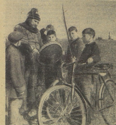
Печенежский воин вступил в «мирные переговоры».