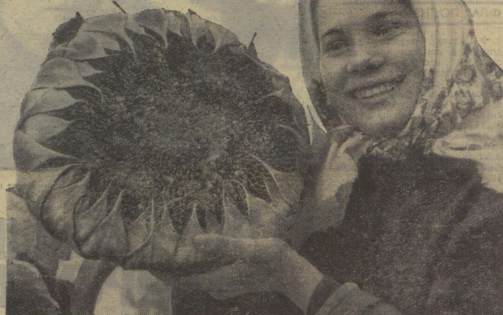
Кто вырастил этот чудо-подсолнух? Ребята из «Малой Тимирязевки» Вязовицкой школы. Рассказ о их делах вы прочитаете на 2-й странице.