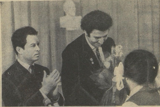
Недавно в ЦК ВЛКСМ Е. М. Тяжелников вручил Микису Теодоракису премию Ленинского комсомола.