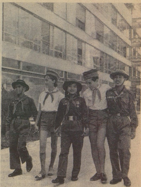
Общими любимицами международной смены 1970 года в Артеке были дети Вьетнама. Мы поздравляем Демократическую Республику Вьетнам с 25-летием и шлём пионерский привет всем её доблестным защитникам.

Поезда, корабли и самолёты развезут артековцев по домам, и в разных странах отзовётся паролем Артека: «В дружбе наша сила!»