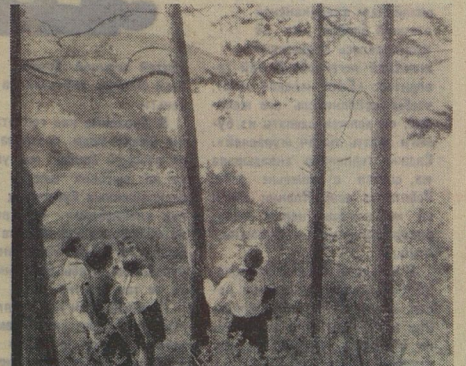
Быстро проходит в лагере день, и один не похож на другой. Сегодня шахматный турнир, и все волнуется: кто же будет шахматным чемпионом? Завтра — поход в лес, где можно и гербария собрать, и порисовать, и просто полюбиться быстрым течением реки Катунь. Незаметно проходит время, кончается смена, а уезжать ребятам из лагеря не хочется: наметил, что совсем недавно приехали.