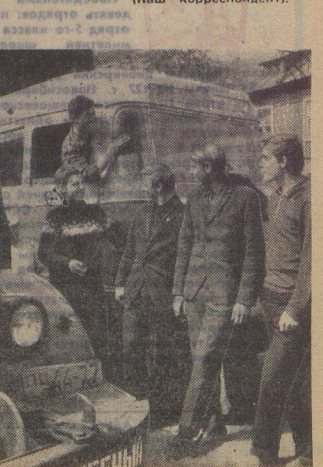
Калининская область, школа № 12 Октябрьской железной дороги

Вот он, наглый, самодовольный израильский солдафон в оккупированном городе Иерусалиме. С помощью штыка и пули, американских ракет и самолётов «Фантом» он хочет создать «великий Израиль» — поработить миллионы арабов и заставить их работать на себя, как этого арабского мальчишка. Отважные патриоты в Иерусалиме отпечатали этот снимок на тысячах листовок, призывая к борьбе. (Снимок с обложки нелегальной брошюры «Факты, которые ты должен знать», напечатанной и распространённой в Израиле).