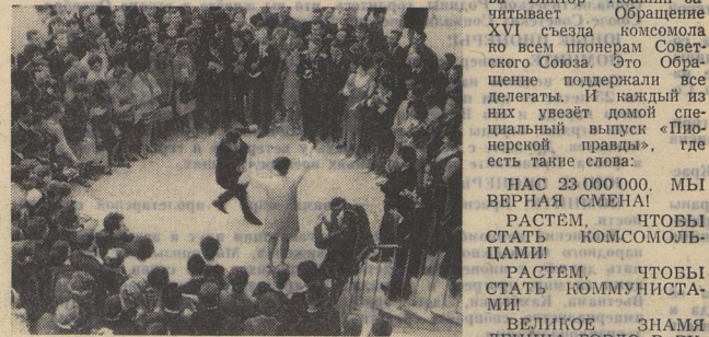
В перерывах между заседаниями съезда царило веселье.