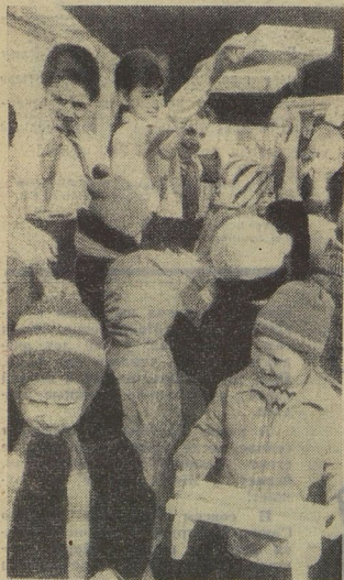
Детский сад «Ёлочка» и школа № 2 стоят рядом. И малыши уже знают: если кончатся уроки, если свободны ребята — обязательно кто-нибудь придёт к ним. Они просто поиграют в прятки или в салочки, а другие принесут подарки: игрушки, сувениры, подставки для цветов. Всё это школьники делают сами в своих мастерских.

секреты фокусов тут можно узнать. Мы теперь сразу угадаем, в какой руке лежит двухкопеечная монета, а в какой трёхкопеечная! Хорошо, когда в руках у вожатого на пионерском сборе или у пионерского костра будет эта интересная книга. (Составитель сборника Е. М. Минский. Издательство ЦС ВЛКСМ «Молодая гвардия», 1969 год). Л. ТИХОНЕНКО.