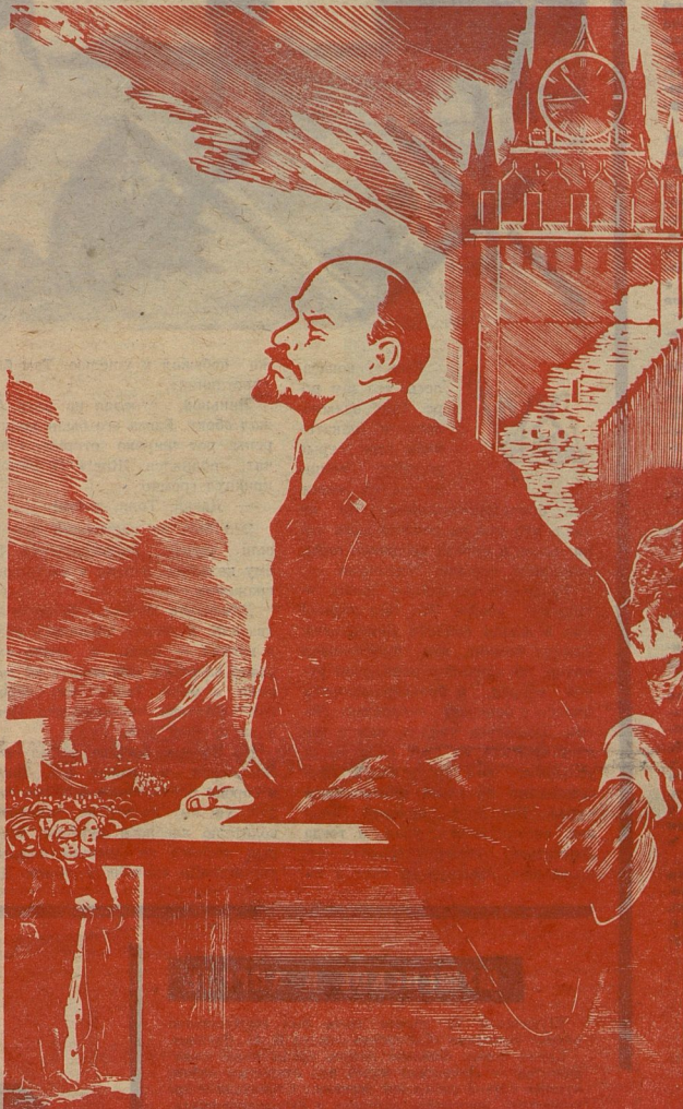
В. И. ЛЕНИН НА КРАСНОЙ ПЛОЩАДИ.

Правда, он потом делал попытку перетрахать их. Он ценит Плеханова, это был большой ум. Но быть дружным с человеком, с которым он идейно расходится, он никогда не мог и расходился с людьми, если они стояли на неверном пути и шли на поводу у буржуазии. Но сплошь и рядом для таких заблуждающихся, которых можно перетрахать, он пускал в ход всё, чтобы на них воздействовать. Личного он не вносил в борьбу ничего, но принципиальность была большая, и поэтому, если не было никакой возможности столкнуться, он с этими людьми порывал.