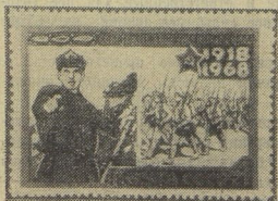
Раздался телефонный звонок: — Станислав Гиларович, очень просим выступить перед призвынками. Герой Советского Союза генерал армии С. Г. Поплавский знал, что гово-

рит будет о 25-летию освобождения Польши. Сам активный участник этих событий, он всё же обращается к своим помощникам — маркам. Почему к маркам? Потому что заслуженный человек со множеством наград — страстный филателист. В собранных им марках — история Советской Армии, а эта история и его жизни — сына батрака, прошедшего с армией долгий путь. ...Мы дома у Станислава Гиларовича. Хозяин достаёт альбом: