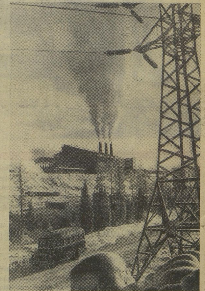
Есть на севере Иркутской области маленькая станция Коршуниха. Затерялась она среди тайги, а назвали её по имени горы, на вершинах которой сельские орды для коршуньи. Но пришли сюда геологи, открыли: место близ таёжной станции богато железными рудами. И теперь Коршунский железорудный горно-обогатительный комбинат отправляет Запсибу и Кузнецкому металлургическому предприятию миллионы тонн сухого железного концентрата.