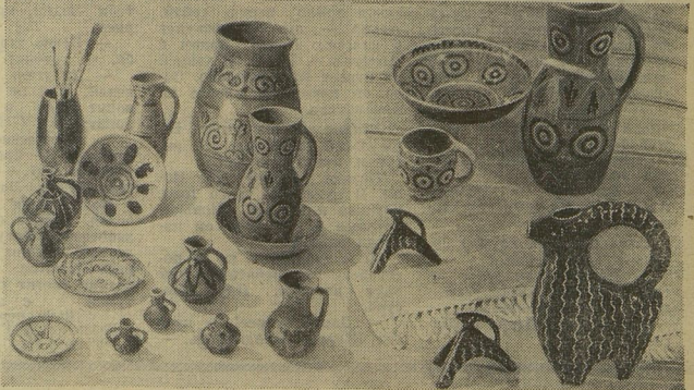
Издавна унгенские народные мастера делали красивые расписные кувшины для молока, кружки. А сейчас гончары работают на Унгенском заводе художественной керамики. Расписанные яркими узорами тарелки, вазы, кувшины украшают многие дома.