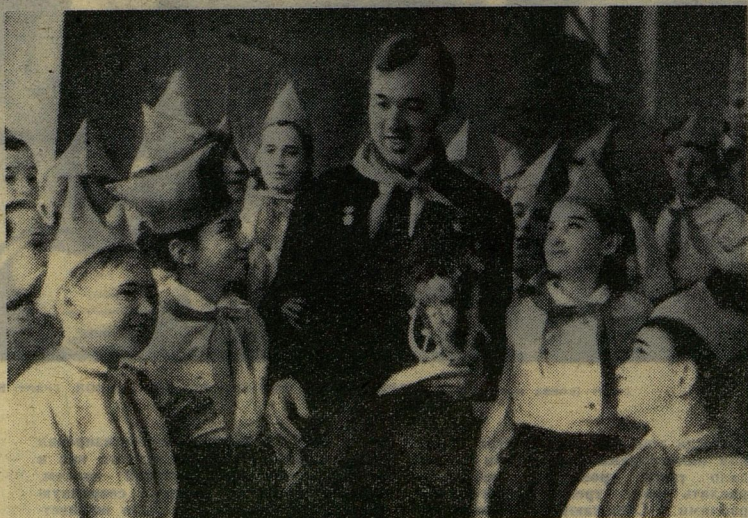
Известие о запуске в космос Героя Советского Союза А. С. Елисева, пожалуй, больше всех взволновало ребят из 170-й московской школы. Весной на торжественной линейке они повзвали космонавту галстук почётного пионера.