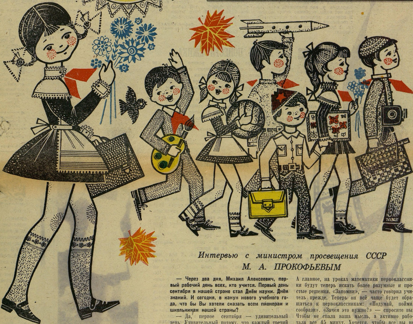
Рис. А. ВЕСТАКОВА.