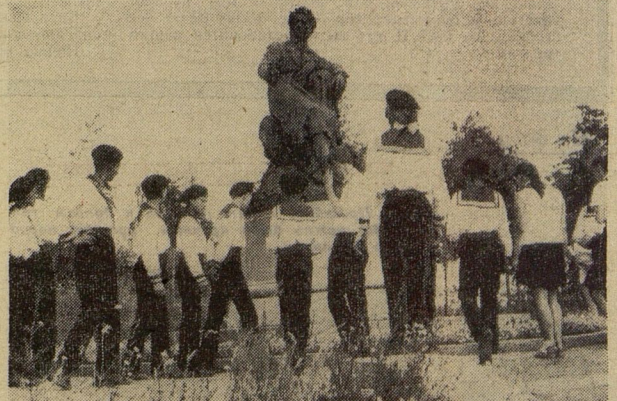
Пушкинский заповедник. Юнармейцы пришли к великому русскому поэту.

Материалы о Всесоюзном финале «ЗАРНИЦЫ» подготовили наши специальные корреспонденты И. АФАНАСЬЕВ, А. ИСАЕВ, В. ГУСЕВ и Я. ШАХНОВСКИЙ. Оформление В. АНДРЕЕВА.