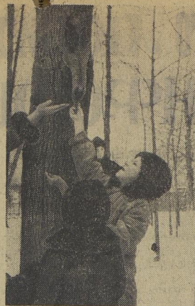
▲ Бери, бери, белка, орешек. Они хоть и малышки, но не обидят. Спустилась пушистая и спокойно грызёт себе орехи. Зимой белкам, как и птицам, нужна забота.

Далеко на севере, в Магаданской области, стоит Усть-Белая восьмилетняя школа. В школе живут и учатся дети оленеводов.