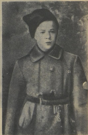
Аркадий Голиков в 1918 году перед отъездом на фронт. За поясом Голикова пистолет-маузер, которому были посвящены многие страницы повести «Школа».