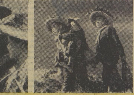
Во время бомбёжки этому мальчику повредило ногу. Но он всё равно учился. Целый год его носили в школу друзья.