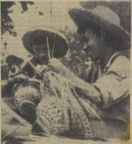
Хозяева этой небольшой мастерской в джунглях не стоят в дозоре, не дежурят у зенитных установок. Но они тоже срываются. Шапята, сплетённые их руками из рисовой соломы, хорошо защищают голову от осколков шариковых бомб.