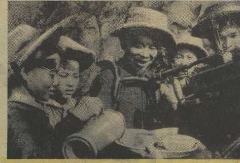
В гости к бойцам-зенитчикам пришли пионеры. Они принесли часовым неба горячий обед.

Я хочу через редакцию «Пионерской правды» передать всем пионерам Советского Союза горячий привет и слова благодарности от пионеров Вьетнама. Главный редактор газеты «Юный авангард» Во Ван ТХОАЙ.