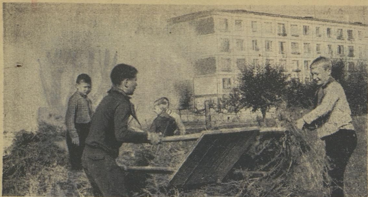
Скоро исчезнет в городе Балашихе последний пустырь. Здесь будет сквер. Это подарок пионеров 12-й школы юбилею комсомола.