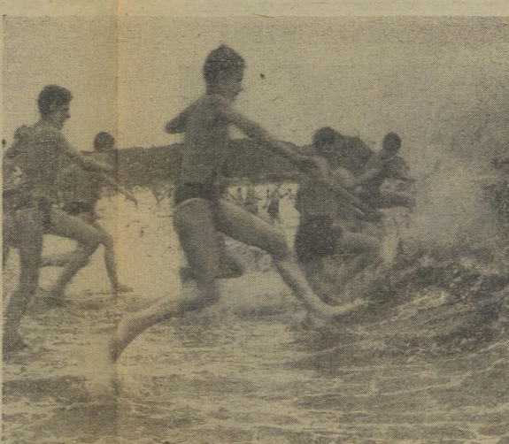
Когда заканчивается сражение, хочется отдохнуть. И ничто так не снимает усталость, как купание. На берегу осталась юнармейская форма, а тихоокеанский залив искрится на солнце и манит ребят. Скорее в воду!

Главный штаб «Зарницы», редакция газеты «Приморская правда» выражают большую благодарность командованию, офицерам и военнослужащим Краснознаменного Тихоокеанского флота, Дальневосточного военного округа, а также работникам Приморского краевого и Владивостокского городских комитетов ВЛКСМ за успешное и образцовое проведение финала Всесоюзной военно-спортивной игры «Зарница» в городе Владивостоке.