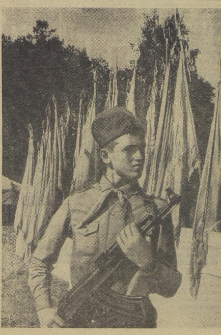
Это пост № 1. Охрана отрядных знамен.