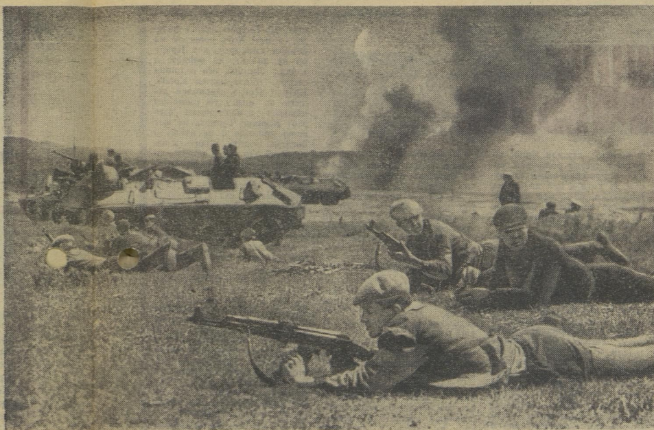
Бой за высоту. Шквальный огонь противника прижимает к земле наступающих автоматчиков.

В этот же день в лагере «Приморье» юнармейцам были вручены гранаты, медали «За отличие» и ценные призы. Знамя каждого отряда-финалиста украсила Большая золотая медаль.