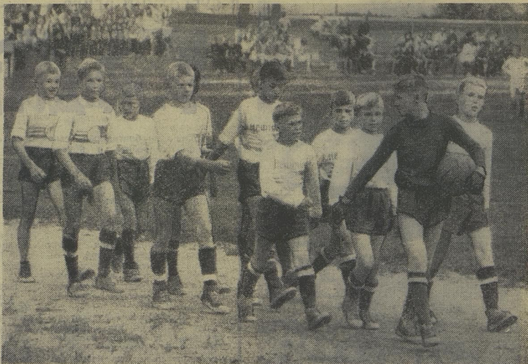
НА СНИМКЕ вы видите, как на очередную игру выходит команда «Нефтяник» из города Долгопрудного.

В младшей группе сильнейшими оказались юные спортсмены из команды «Полос» города Чехова, победившие в решающем матче своих сверстников из города химиков Воскресенска — 2 : 0. У старших трудную победу одержали ребята из Пушкино. Их команда «Электрон» сумела переиграть соперников из егорьевского «Авиатора». Счёт — 2 : 1. Позвело, скажут некоторые. Но счастье в спорте даётся сильным. А именно такими и считаются юные футболисты из Пушкинского района: у них, только в отборочных соревнованиях участвовало почти четыреста команд.