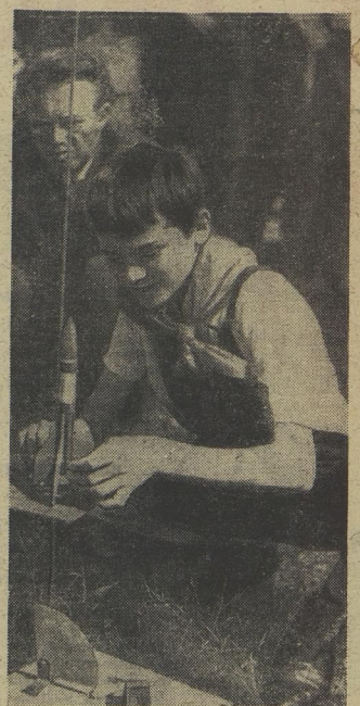
НА СНИМКАХ: Авиамодель — это первый шаг в небо; «охотники» пошли за «лисой». Ни пуха ни пера! Через несколько секунд ракета спрячется за облаками.